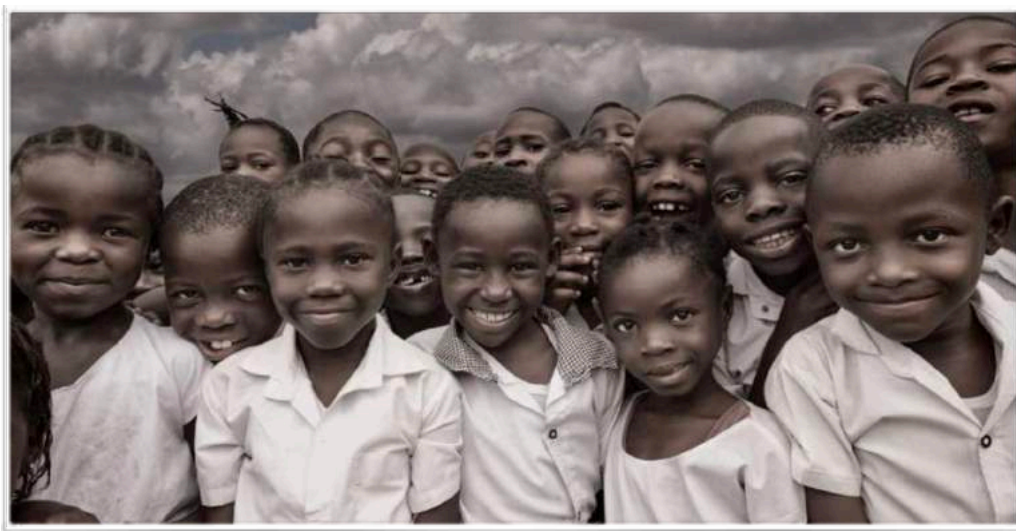
Foto is onderdeel van “Wildish Gambit” en gemaakt door Roberta Marroquin